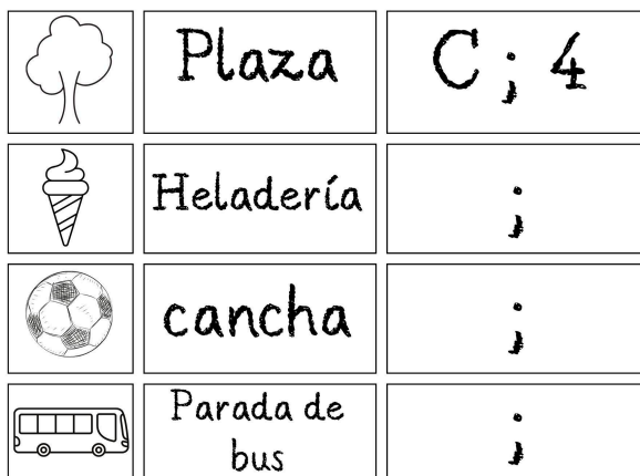
Tabla para copiar y completar en cuaderno: